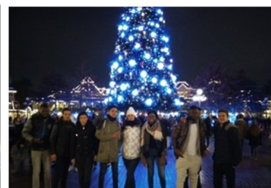
Photo 1 : Le château de Disney illuminé ; Photo 2 : Le groupe de la première sortie à Disney, devant le sapin de Noël.