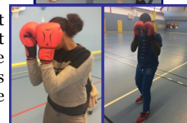
Nous à la boxe.